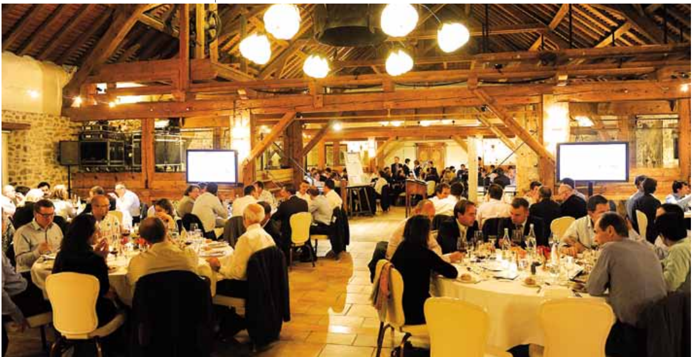
ETT CLOUD & ICT SUMMIT - Soirée de gala 200 personnes