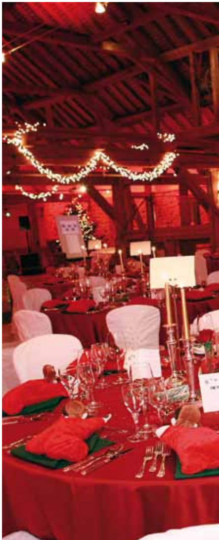
REYL & CIE SA - Soirée de Noël