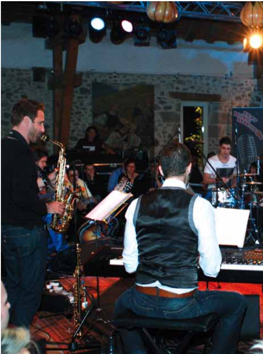
SEAT MUSIC SESSION - Concert 220 personnes

et à tous ceux envers lesquels nous respectons le désir de confidentialité.