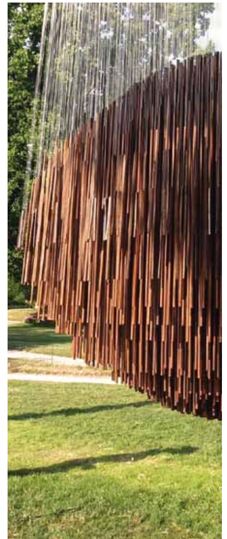
Bing Bang 2009