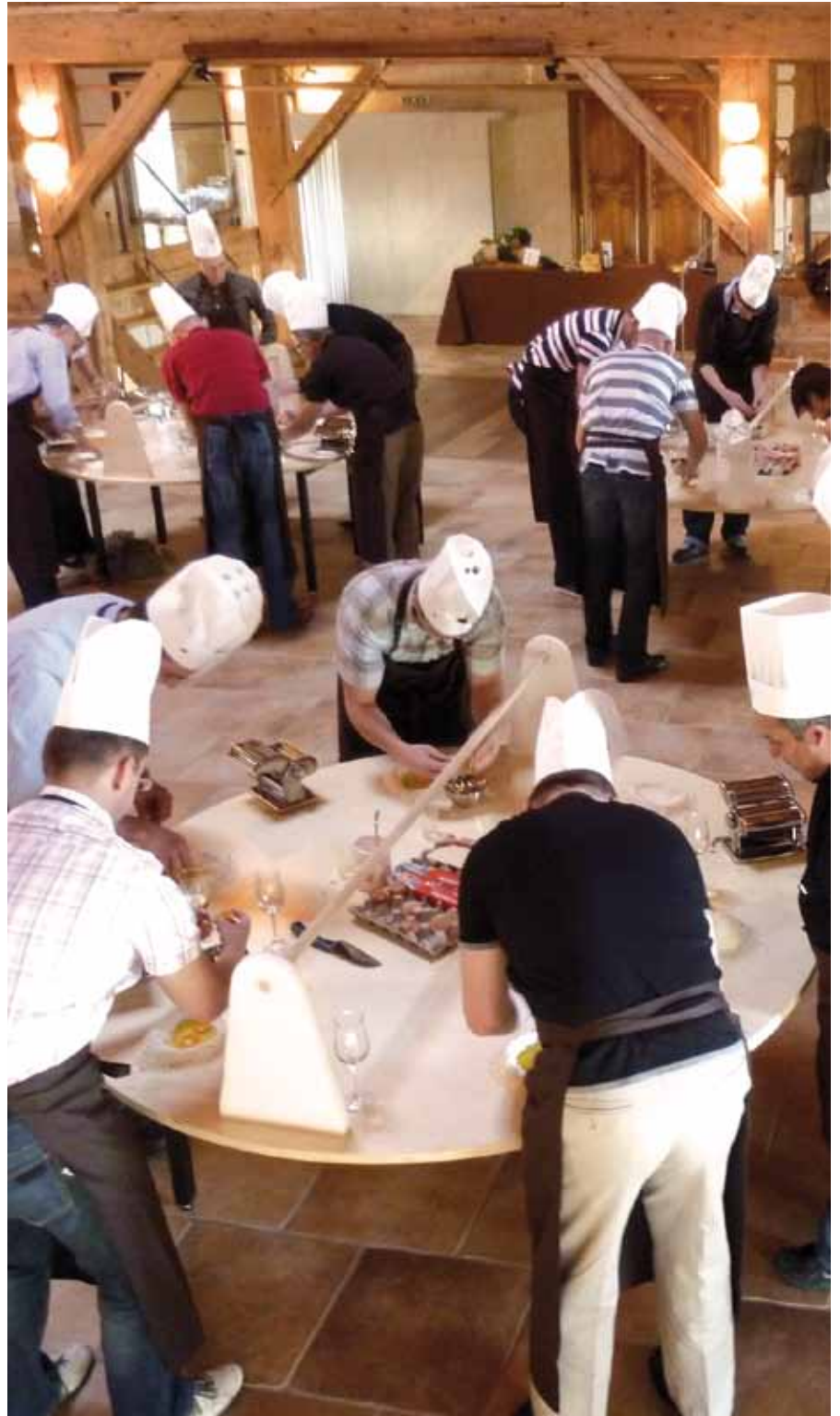
Postfinance - Conférence et cours de cuisine pour 70 personnes