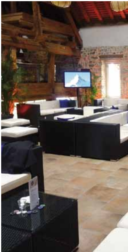
Axa Winterthur - Soirée casino

L'artiste vaudois à la carrière internationale crée dans son laboratoire d'Yverdon-les-Bains des œuvres métalliques inédites et imposantes qui mettent au premier plan le son et le mouvement, ainsi que le contraste entre monumentalité et fragilité. Lauréat du prix de la Fondation Sandoz 2009, Etienne Krähenbühl présente notamment à Vullierens le Bing Bang , une sphère métallique cinétique et sonore de 3,5 mètres de diamètre, animée par un phénomène de pulsations et de respirations.